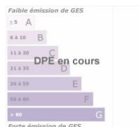
DPE ANCIENNE VERSION